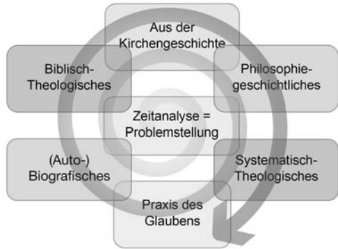
Abbildung 2: Spiralcurriculum

sich so viel besser vernetzen. Einer meiner Lehrer, Sven Findeisen, war Meister darin. Die beiden Abbildungen hierzu zeigen, was ich meine.